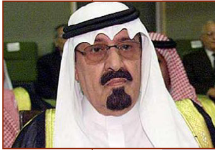
دوماهنامه فرهنگی دانشجویی